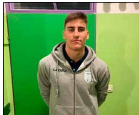
URBAN FUŽIR (Volley klub Portorož)

JADRANJE/ OPTIMIST 192. mesto ml. SP, Garda/Italija