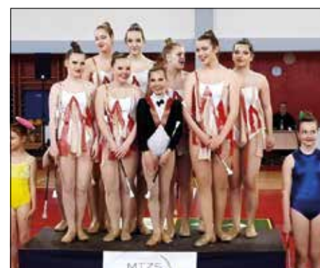
Ekipa Twirling in mažoretni klub Lucija TWIRLING/ GROUP JUNIOR/ KADETINJE 1. mesto kad. MT, Samobor/Hrvaška